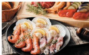
スタンダードBBQ ¥ 4,300

牛ロース、鶏もも肉、豚肩ロース、グリルドベジ、殻付きホタテ、骨付きソーセージ、有頭海老、ヤリイカ、焼きおにぎり