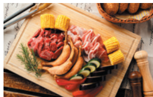
バリユ- BBQ ¥ 3,300

クォーターポンドステーキ、骨付きスペアリブ、チキンレッグ、アパタイザー、骨付きソーセージ、ポップコーン、グリルドベジ、カンバーニュ、ポテトポロネーゼグラタン、ガーリックシュリンプ