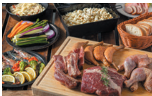
プレミアムBBQ ¥ 5,500

牛ロース、鶏もも肉、豚肩ロース、グリルドベジ、殻付きホタテ、骨付きソーセージ、有頭海老、ヤリイカ、焼きおにぎり